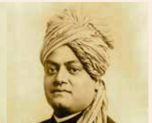
スワミー・ヴィヴェーカーナンダ