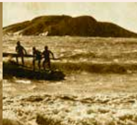
カンニヤークマリ